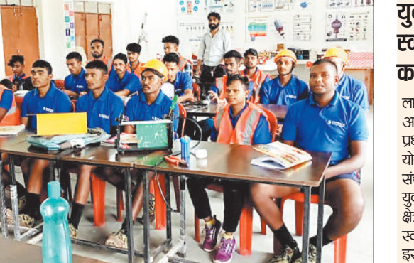
आवेदन के लिए लगेये यह दस्तावेज: आवेदन करने वाले युवा को न्यूनतम शैक्षिक योग्यता 8वीं पास और न्यूनतम उम्र 18 वर्ष और अधिकतम 35 वर्ष होनी चाहिए आवेदन के दौरान आधार कार्ड, चार फोटो, शैक्षिक योग्यता प्रमाण पत्र के साथ बैंक पासबुक और आधार कार्ड से लिंक मोबाइल नंबर संस्थान में जमा करना होगा। आवेदन लाइवलीहुड कॉलेज में ही ऑफलाइन लिया जा रहा है। इस प्रक्रिया के बाद आवेदन पत्र की जांच कर तय समय में युवाओं को प्रशिक्षण दिया जाएगा।

जशपुर स्थित लाइवलीहुड कॉलेज में असिस्टेंट इलेक्ट्रिशियन कोर्स के लिए निःशुल्क प्रशिक्षण दी जाएगी। इनमें रिपेयरिंग स्विचिंग डिवाइस स्थापित करने, बिजली उपकरणों का निर्माण, विद्युत सुरक्षा उपकरण निर्माण, वायरिंग मरम्मत या फिर इलेक्ट्रॉनिक उपकरण मरम्मत की ट्रेनिंग दी जाएगी। 90 दिन की ट्रेनिंग के बाद संस्थान की तरफ से युवाओं को प्रमाण पत्र भी दिया जाता है। इससे वह आगे चलकर अपने खुद के रोजगार की शुरुआत कर सकते हैं। आवसीय सुविधा के साथ प्रशिक्षण पूरी तरह से निः शुल्क है।