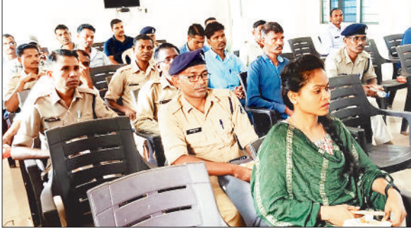
आयोजित कार्यशाला में उपस्थित पुलिस।

दुष्परिणाम के बारे में बारिकी से बताया, कि वह किस प्रकार परिवार एवं समाज पर असर डालता है। लगातार नशा करने से व्यक्ति के सोचने-समझने की शक्ति कम हो जाती है, वह एक्टिव नहीं रहता है। मानसिक तनाव दूर करने में योग, विभिन्न प्रकार के खेल, संगीत सुनना शोष पेज 4 पर