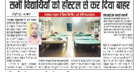
अधीक्षक ने भोजन करते बच्चों से की मारपीट सभी विद्यार्थियों को हॉस्टल से कर दिया बाहर

कुछ बच्चे रात के अंधेरे में पैल गए घर, कुछ भटके